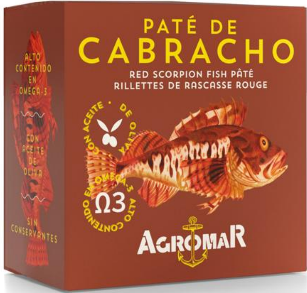
Peso aprox 100g