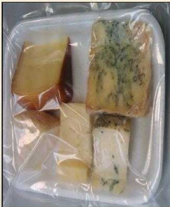
Tabla de Quesos asturianos

Composición: 5 variedades de quesos; Cabrales, Peñamellera, Cuevas del Mar (Cabra), Vidiago y Ahumado de Pría.