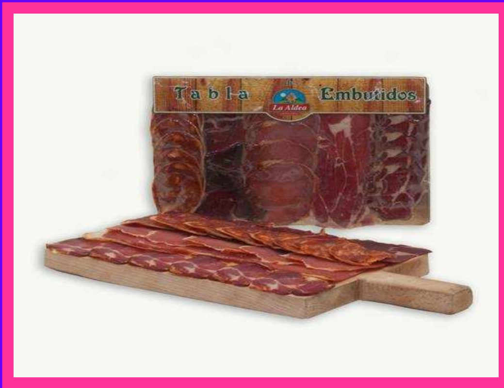
Tabla de Embutidos Asturianos.