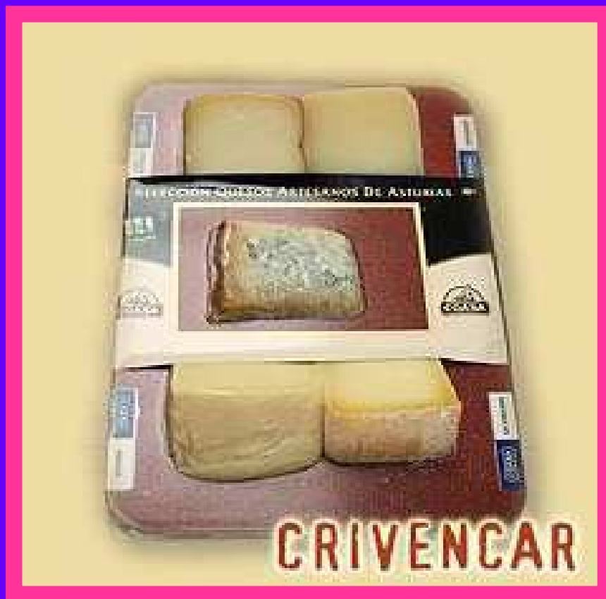
Tabla Mini quesos Asturianos.