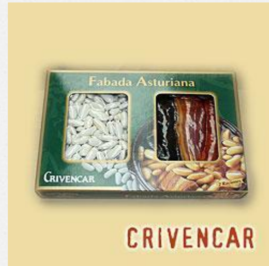
Tabla de preparado de Fabada Asturiana con ingredientes selectos para 2 raciones. Ingredientes: Fabes, tocino, lacón, chorizo y morcilla. Precio: 6 .00 €